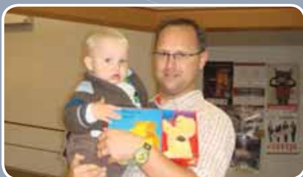
Boekbaby's krijgen een cadeauboekje in de bib.