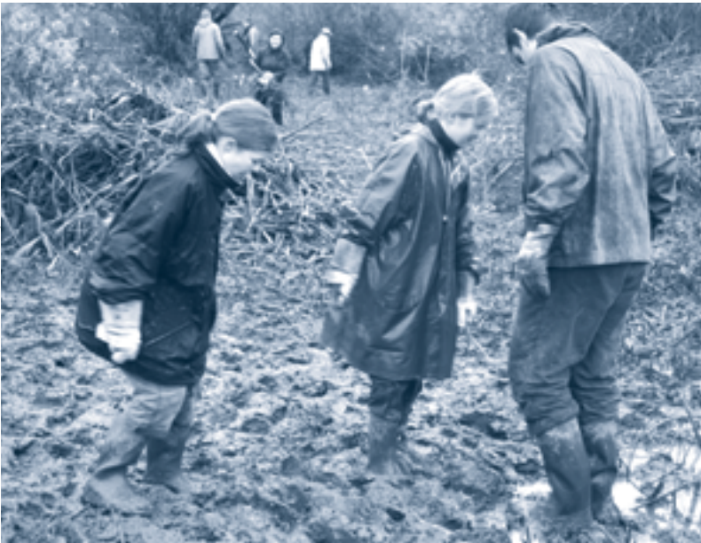
Handen uit de mouwen in de ruige natuur bij de deur!