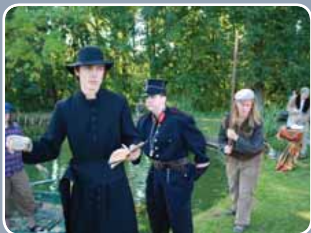
Veel sfeer tijdens De Donk verbeeld/t. Hier zie je enkele Panta Rheileden in een tableau vivant langs het Donkmeer.