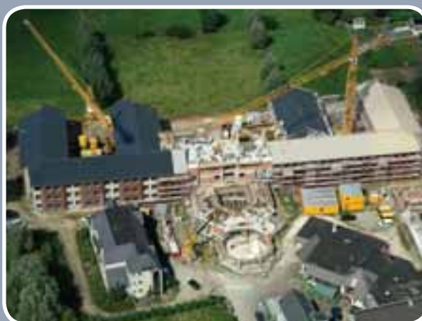
De werken aan het nieuwe woon- en zorgcentrum Ter Meere schieten goed op.