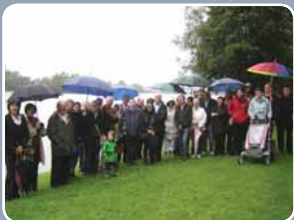
Het gemeentebestuur organiseerde een ontbijtwandeling voor nieuwe inwoners. De dappersten waagden zich aan een natte wandeling. De overige aanwezigen bleven lekker droog in Festivalhal Donkmeer.