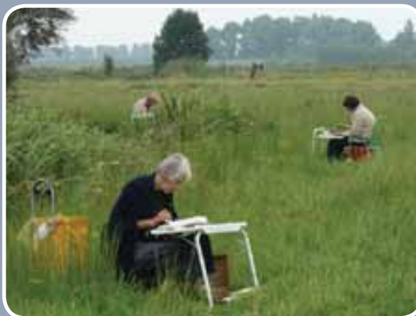
Tijdens de derde vakantie cursus natuurschilderen maakten de cursisten op een intense manier kennis met hun liefhebberij, midden in de natuurgebieden van Zele en Berlare.