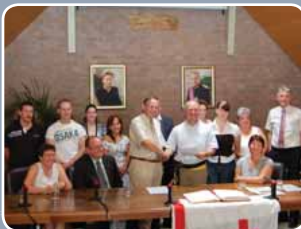
Rode Kruis Berlare kon tijdens een plechtige hulding het EHBO-brevet uitreiken aan 19 cursisten.