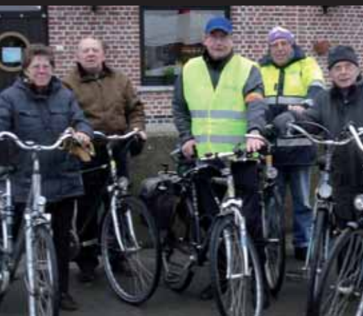
Midweekfietsochten: 12 en 26 januari en 9 en 23 februari

Meer UiTtips op www.UiTInBerlare.be en www.UiTInVlaanderen.be .