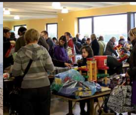
Tweedehandsbeurs: 4 februari