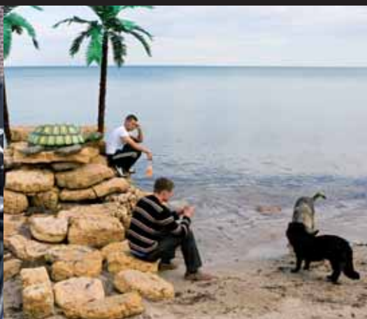
Nick Hannes: nog tot 29 januari