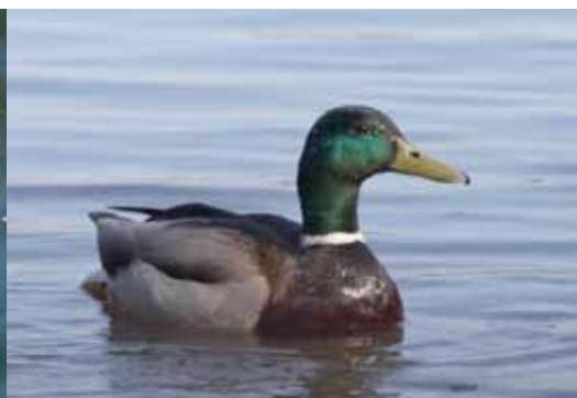
Wilde eend