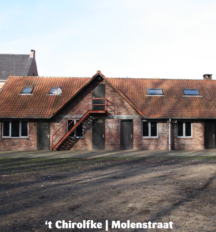
't Chirolfke | Molenstraat