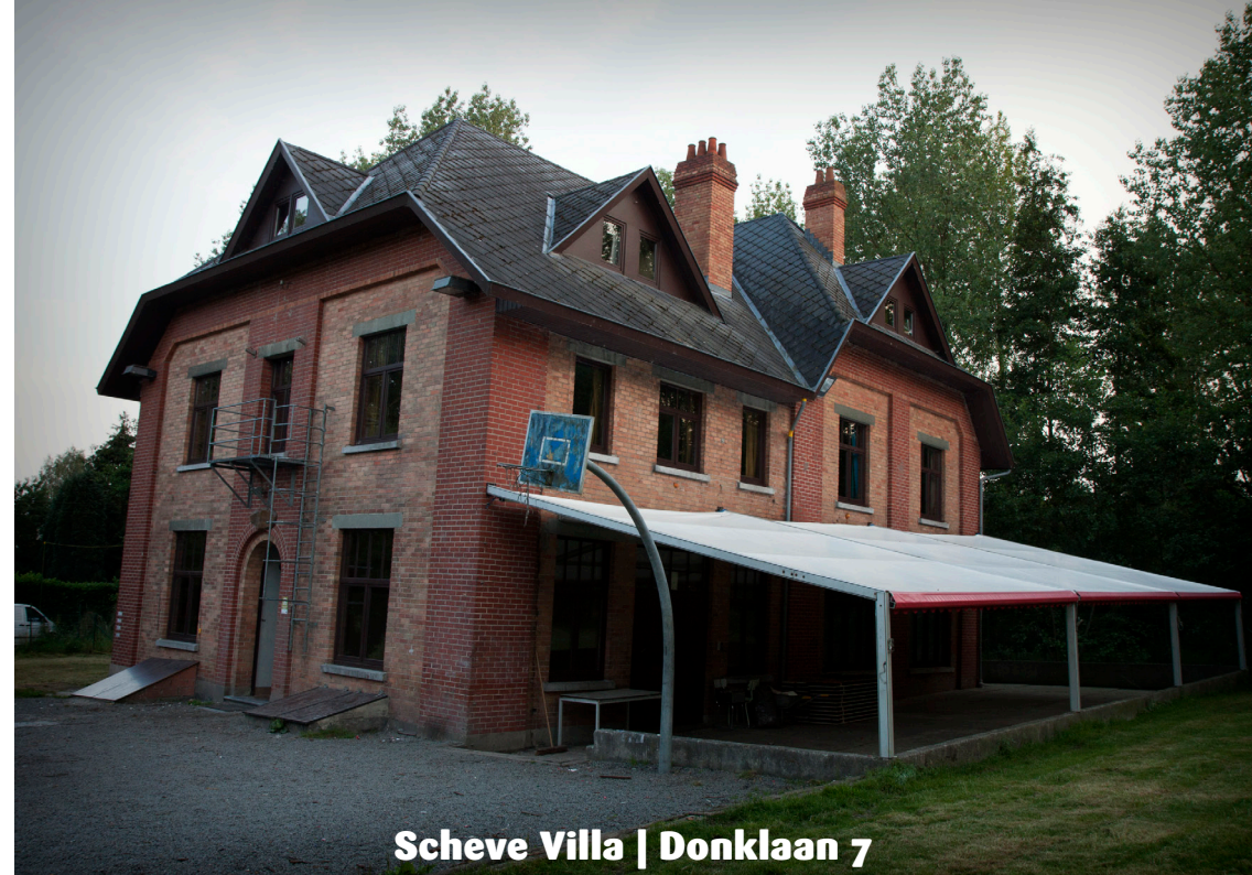
Scheve Villa | Donkiaan 7