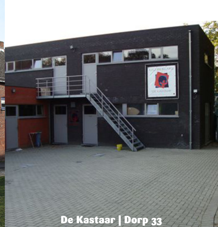
De Kastaar | Dorp 33