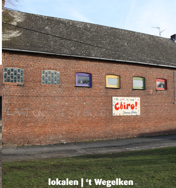
lokalen | 't Wegelken